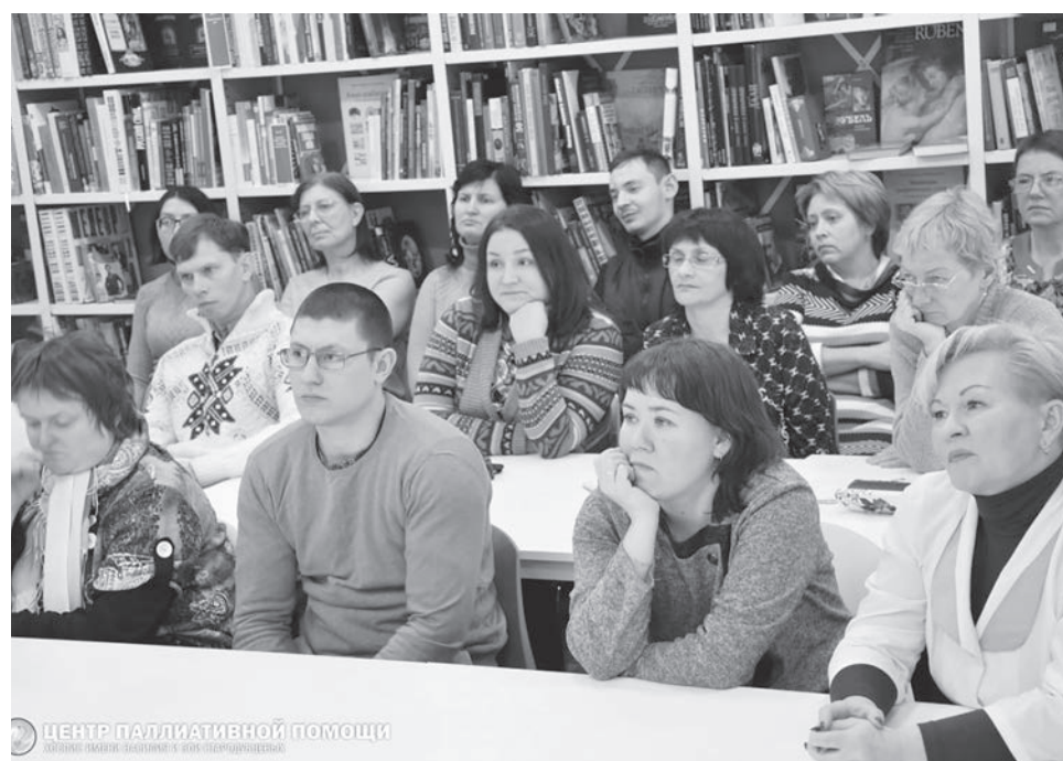
ЦЕНТР ПАЛЛИАТИВНОЙ ПОМОЩИ

Для проведения занятий по уходу за тяжелыми больными в Железнодорожск едут высококвалифицированные медицинские сестры онкодиспансера. Их опыт в обучении родственников бесценен. Они – главные бойцы в реабилитации стомирован-