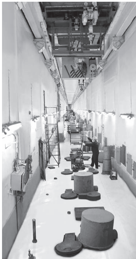
▲ «Завод Б», объект 22, обогатительная фабрика, Горнорудный завод — под этими названиями со времен холодной войны и до 2001 года скрывалось легендарное и ключевое для Горно-химического комбината производство — радиохимический завод.