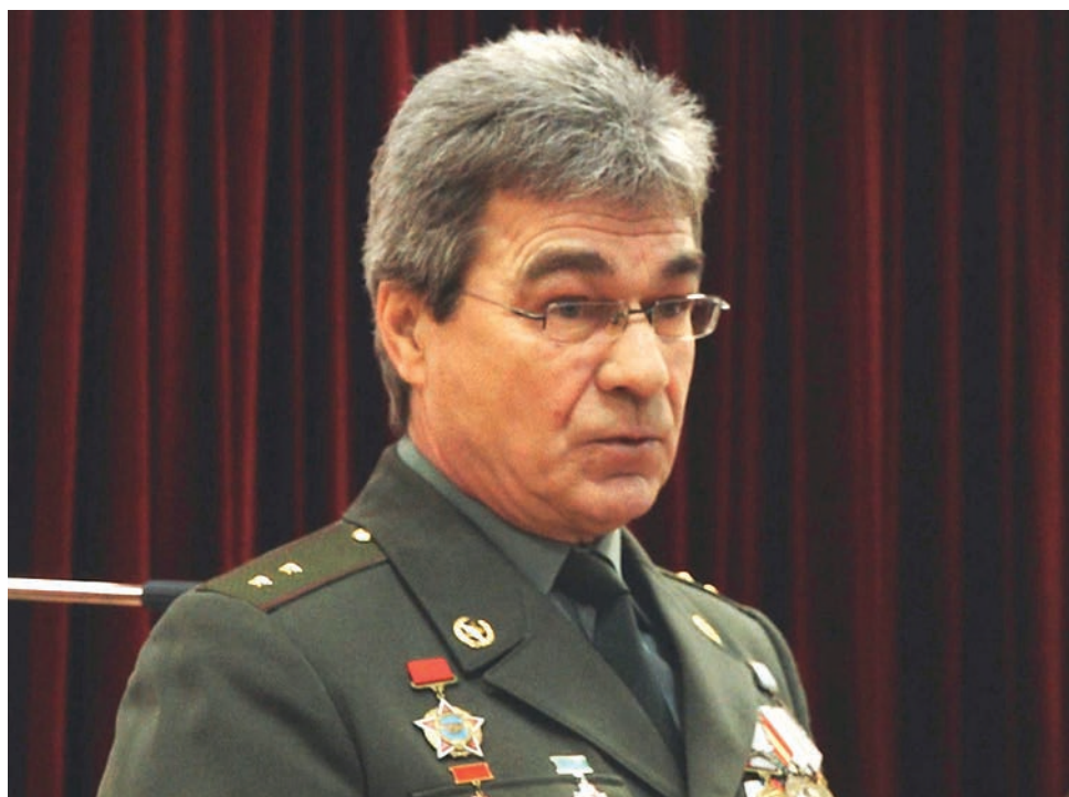
15 февраля Россия отметила День памяти воинов-интернационалистов. О подвигах наших бойцов старшеклассникам Лицея №102 рассказали представители железнодорожного отделения «Боевое братство».