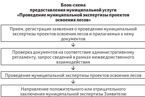
Приложение №2 к административному регламенту