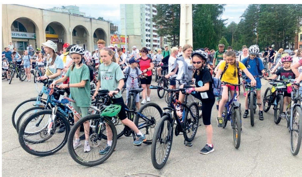
Полторы сотни велосипедистов промчались по городу под флагом России. ▲