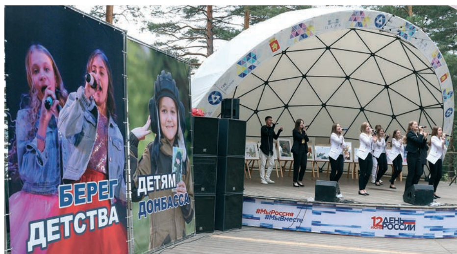
Благотворительный концерт вокальной студии «Берега детства». ▲

Праздник прошел при поддержке Госкорпорации «Росатом» и Горнохимического комбината и получился очень динамичным и ярким.