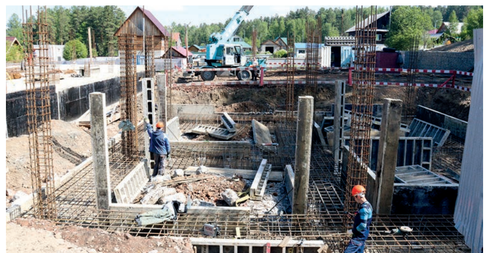
Строящиеся корпуса многофункционального лыжного центра.