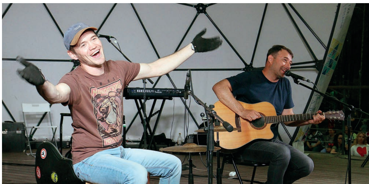
Сотни железнгорцев отрывались на рок-концерте. ▲