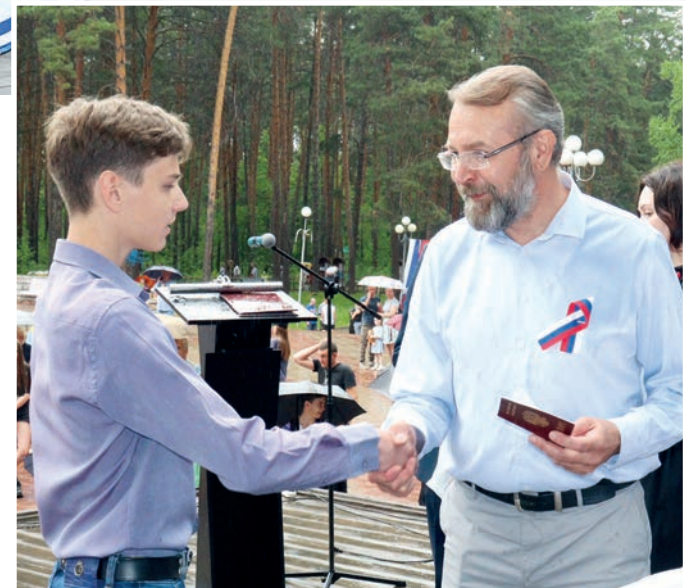
«Я – гражданин России!» – могут теперь сказать двенадцать юных железнорожцев. Они получили свои первые паспорта. ▲