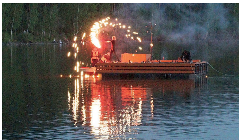
Завершился праздник свето-пиротехническим шоу «Сияние России». ▲