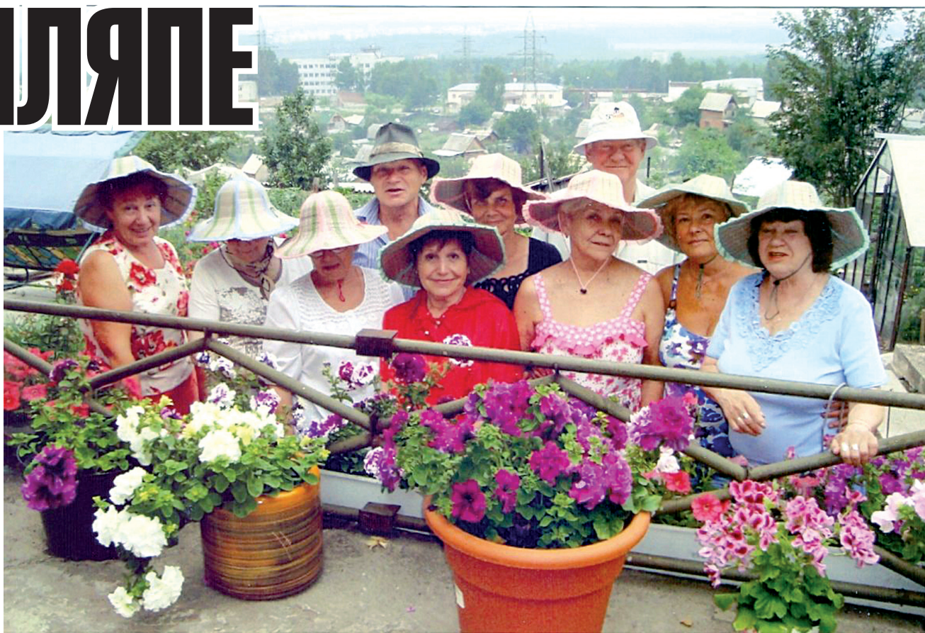
Кадр на память.

Фотоконкурс «Дело в шляпе» набирает обороты. Больше трехсот снимков в альбомах соцсетей! Но это не предел. До 20 ноября еще есть время! Присылайте фото на электронный ящик gig-26@mail.ru , приносите в редакцию (ул. Комсомольская, 25а) или выкладывайте в специальных альбомах в соцсетях «ВКонтакте» или «Одноклассники». Победителей ждут сертификаты от магазина электротоваров «Элекс»: 1 место - 3000 рублей 2 место - 2000 рублей 3 место - 1000 рублей Призы в номинациях «Лучшее детское фото» и «Самая креативная шляпа» - сертификаты на 1000 рублей - предоставлены творческим магазином «Венеция».