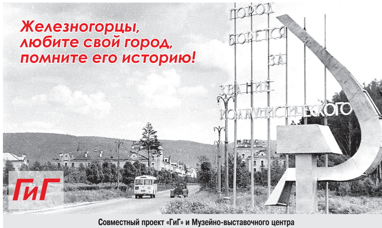
Совместный проект «ГиГ» и Музейно-выставочного центра

Прямое включение на телеканале «Мир-24» в сетях ГТС в 12.30. Задавайте вопросы по телефону 766-200, а также присылайте на сайт www.tv.k26.ru .