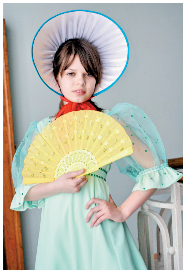
Из тургеневского романа.