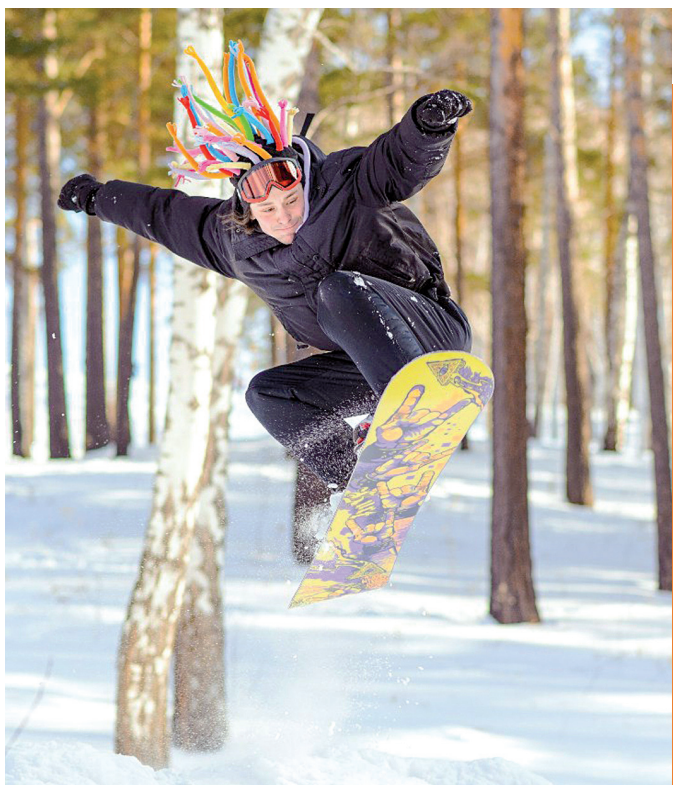
Унесенный ветром.