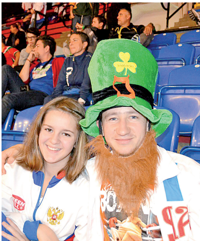
Россия - чемпион!