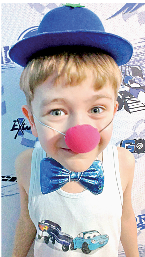
Весь вечер на арене.