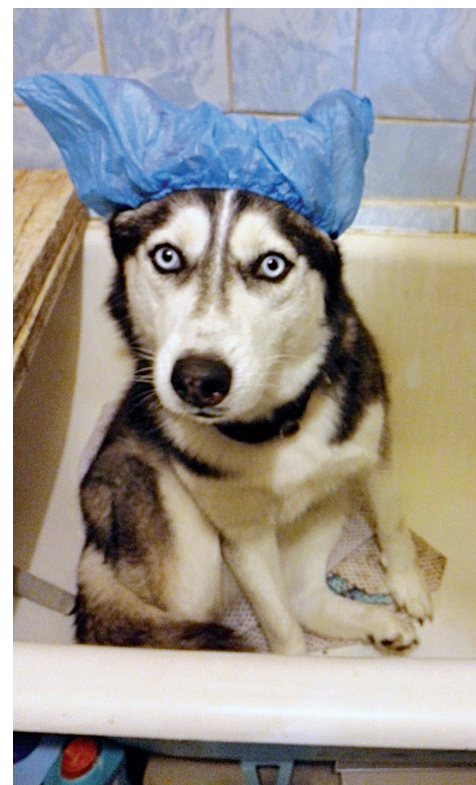
Примеряя бахилы.