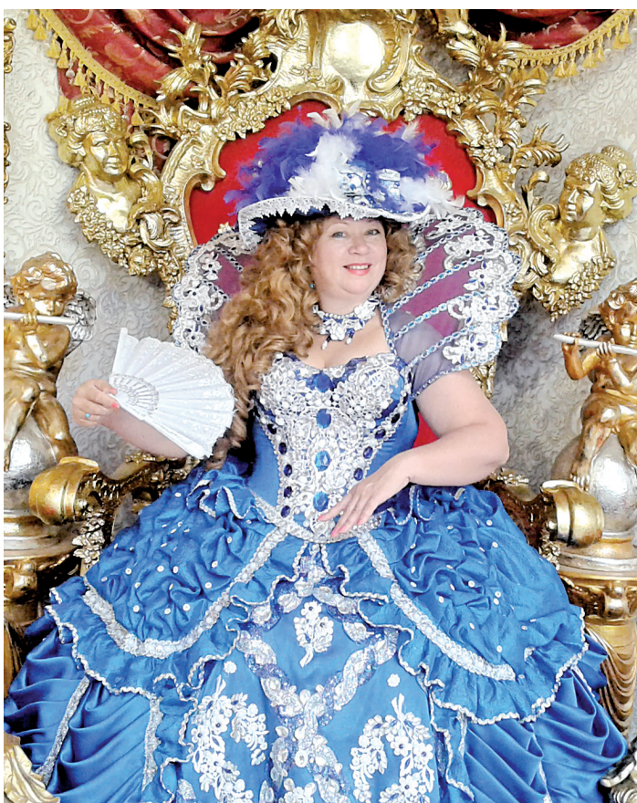
В королевских покоях.