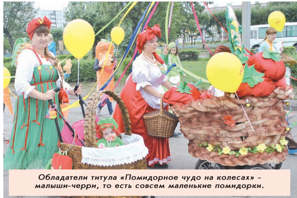
Обладатели титула «Помидорное чудо на колесах» - малыши-черри, то есть совсем маленькие помидорки.