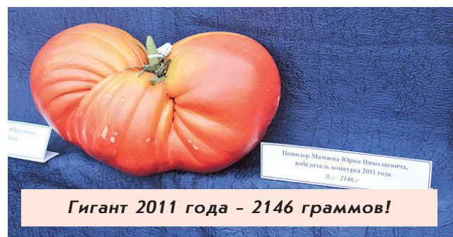
Гигант 2011 года - 2146 граммов!