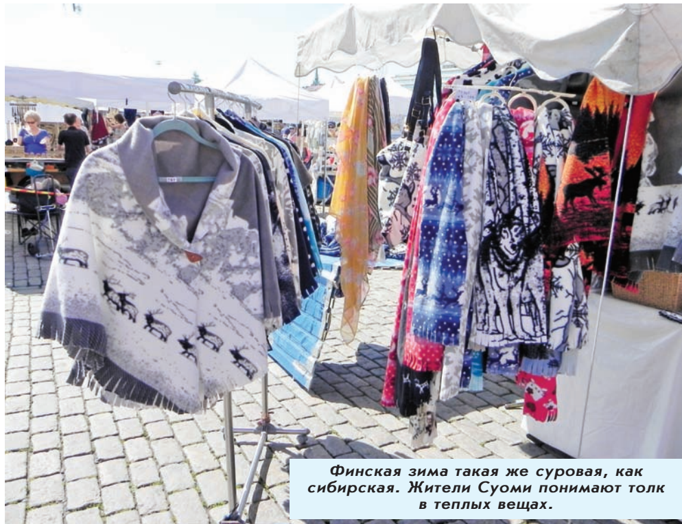
Финская зима такая же суровая, как сибирская. Жители Суоми понимают толк в теплых вещах.