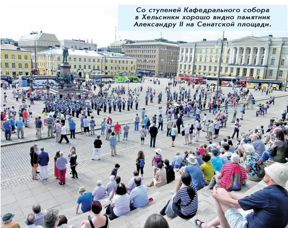
Со ступеней Кафедрального собора в Хельсинки хорошо видно памятник Александру II на Сенатской площади.

Как долго я старалась сохранять интригу! Ведь вы же не подумали, что мы поехали в Финляндию просто так - на велике погонять? Отнюдь! Цель нашей поездки - попасть на концерт британской рок-группы Muse. Именно такое объявление нам попало в Санкт-Петербурге, и мы не упустили эту возможность. Главное, что заграничного спорта были с собой, а тургентство брало на себя все вопросы по открытию визы. Причем финская виза самая простая из всех шенгенских по количеству документов, но совершенно не самая дешевая. Билеты на поле олимпийского стадиона, автобус и размеще-