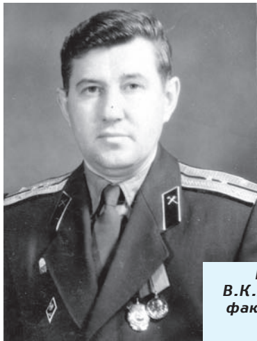
Благодаря воспоминаниям В.К.Машера стали известны сотни фактов из истории строительства Девятки.

Музейно-выставочный центр, казалось бы, в Железногорске был всегда. Для взрослых и маленьких горожан он давно стал одним из интереснейших учреждений культуры и искусства, к тому же имеющим особую специфику: он портал в историю. Но на самом деле музей принял первых посетителей 27 августа 1988 года. А за четыре года до того началась работа по его созданию. Одновременно с капитальным ремонтом выделенного на Свердловка здания проводились сбор и прием экспонатов. Большинство из них - письменные источники.