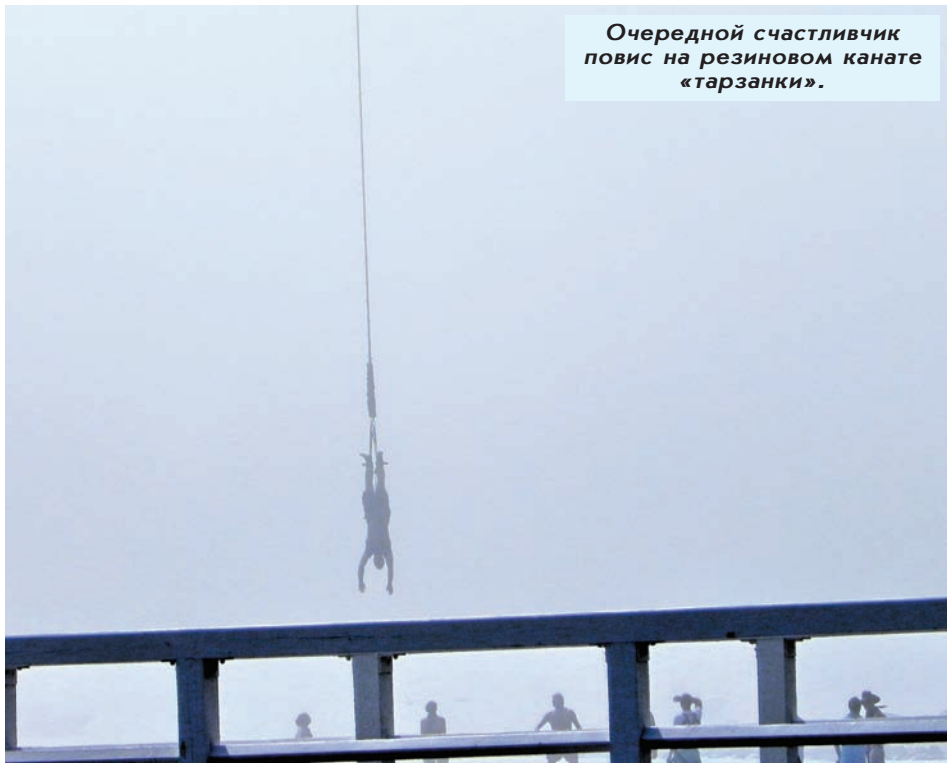
Очередной счастливчик повис на резиновом канате «тарзанки».