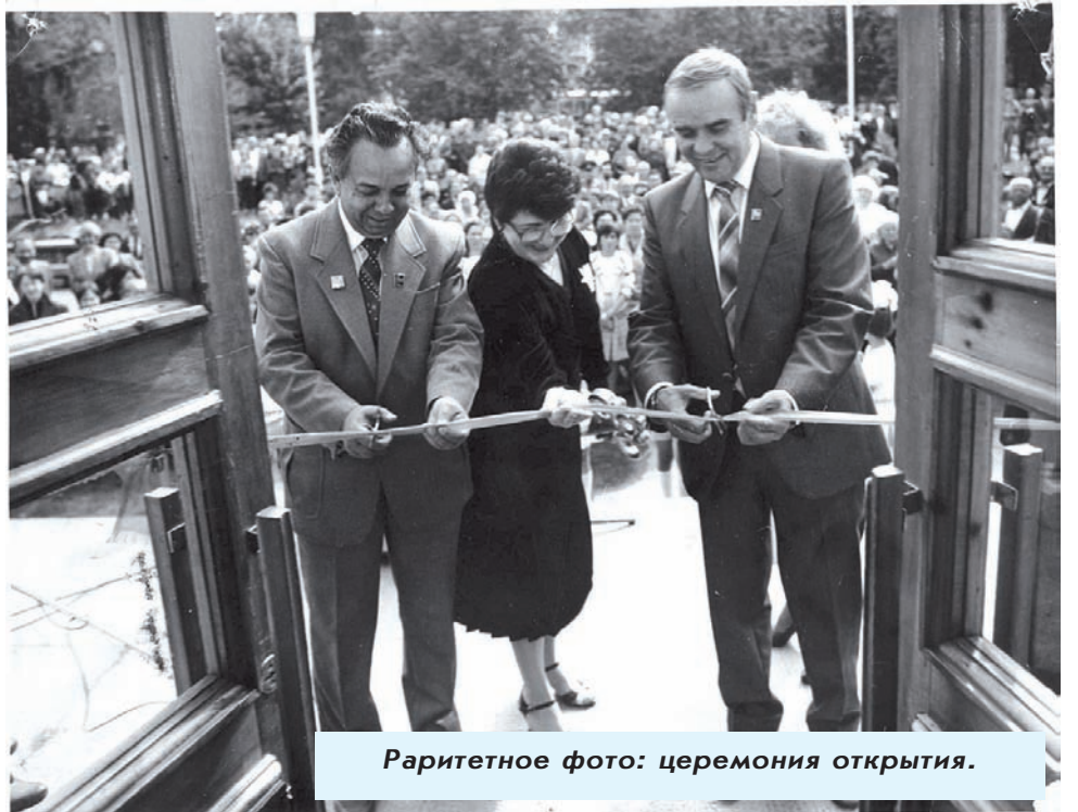
Раритетное фото: церемония открытия.

- В управлении культуры менялись руководители, но дамoclова мечта надо мной никогда не было. Всегда получается найти компромиссы. Я и своим всегда говорю: никогда ни перед