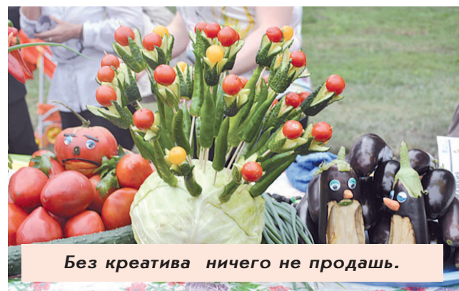
Без креатива ничего не продашь.