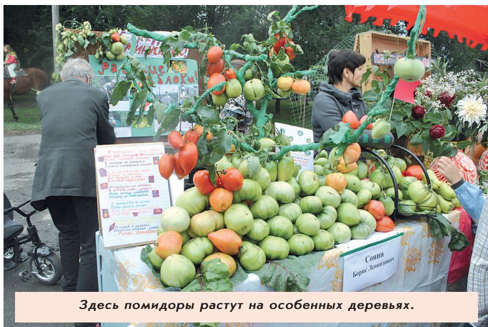
Здесь помидоры растут на особенных деревьях.