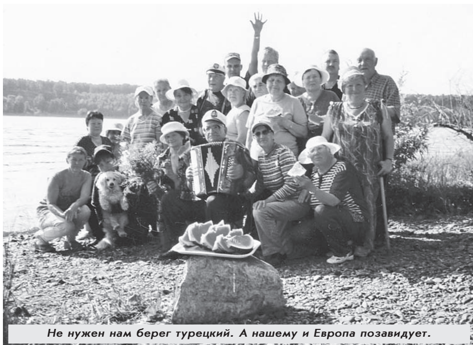
Не нужен нам берег турецкий. А нашему и Европа позавидует.