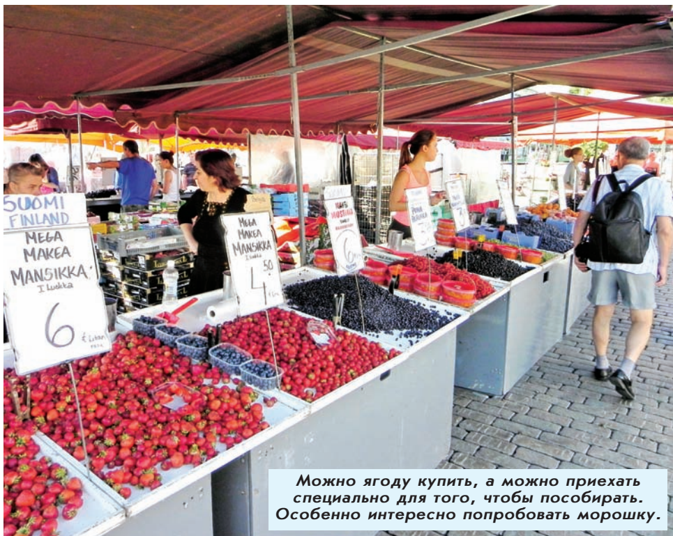
Можно ягоду купить, а можно приехать специально для того, чтобы пособирать. Особенно интересно попробовать морошку.

и отправилась со всеми. Спокойно зашли, строгий дядька в форме на входе молча проводил всю нашу делегацию взглядом. Зашли куда надо, вышли... все просто - до обидного. Вот интересно, а если к нам в администрацию приезжих по надобности водить? Пустят? И еще про мэрию - в ее штате есть переводчики, владеющие языками всех национальностей, проживающих в стране, чтобы любой обратившийся мог без проблем говорить на своем языке.