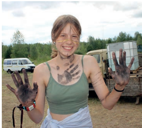
Москвы, Абакана, Красноярска, проводят лекции, семинары, работают с ребятами в поле.