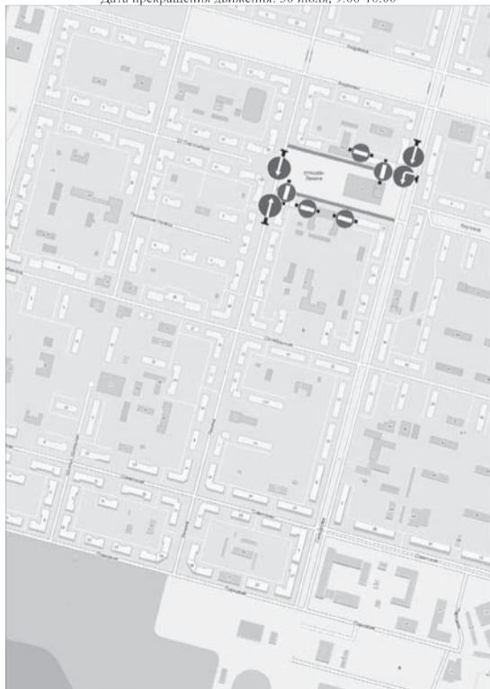
Схема установки дорожных знаков Дата прекращения движения: 30 июля, 9:00-10:00

Знаки устанавливаются в соответствии с требованиями ГОСТ Р 52289-2004 «Технические средства организации дорожного движения. Правила применения дорожных знаков, разметки, светофоров, дорожных ограждений и направляющих устройств», ГОСТ Р 52290-2004 «Технические средства организации дорожного движения. Знаки дорожные. Общие технические требования».