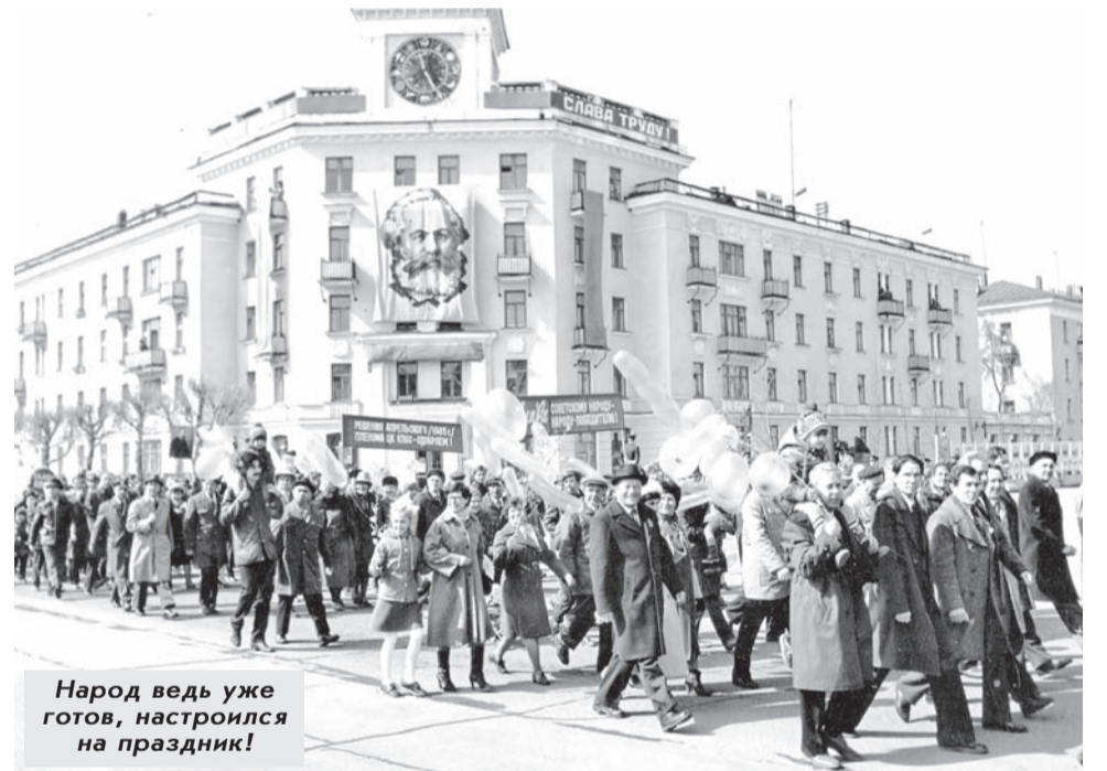
Народ ведь уже готов, настроился на праздник!