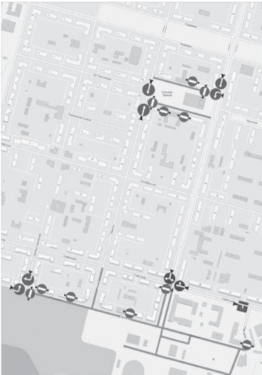
Схема установки дорожных знаков Дата прекращения движения: 30 июля, 10:00-11:00

Знаки устанавливаются в соответствии с требованиями ГОСТ Р 52289-2004 «Технические средства организации дорожного движения. Правила применения дорожных знаков, разметки, светофоров, дорожных ограждений и направляющих устройств», ГОСТ Р 52290-2004 «Технические средства организации дорожного движения. Знаки дорожные. Общие технические требования».