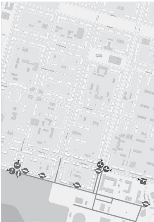
Схема установки дорожных знаков Дата прекращения движения: 30 июля, 12:00-23:30

Знаки устанавливаются в соответствии с требованиями ГОСТ Р 52289-2004 «Технические средства организации дорожного движения. Правила применения дорожных знаков, разметки, светофоров, дорожных ограждений и направляющих устройств», ГОСТ Р 52290-2004 «Технические средства организации дорожного движения. Знаки дорожные. Общие технические требования».