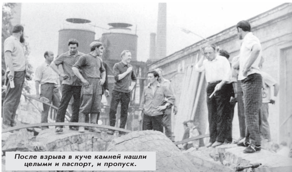
После взрыва в куче камней нашли целыми и паспорт, и пропуск.