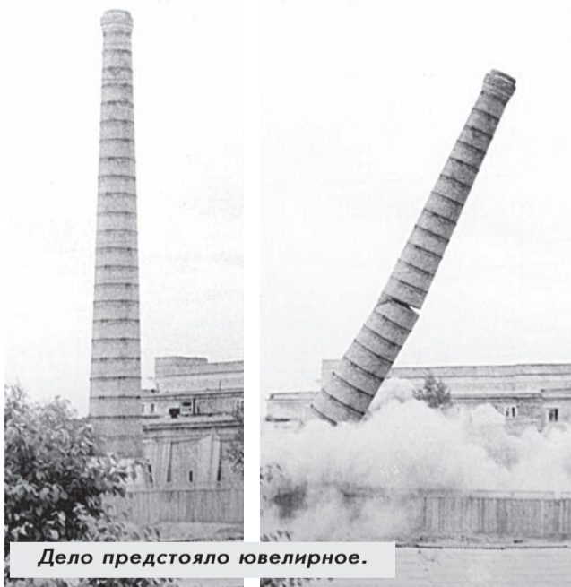
Дело предстояло ювелирное.